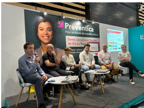
Préventica oct 2024 Lyon

Tout au long de l'année l'AFQP AuRA participe à des événements (conférences, tables rondes, débats,...) organisés en collaboration avec ses partenaires