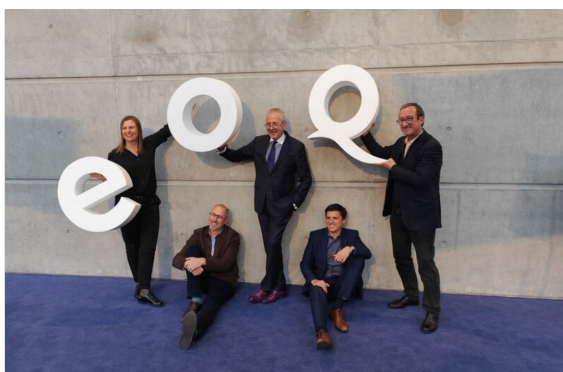
Congrès EOQ nov 2024 Reims