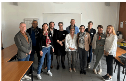
Forum ISO50001 sept 2024